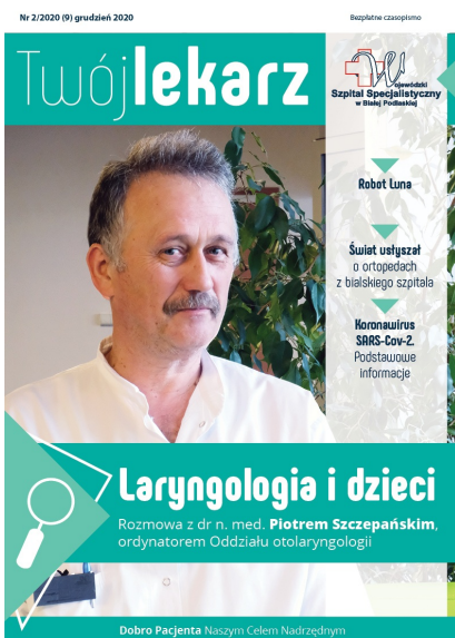
Twój Lekarz - grudzień 2020