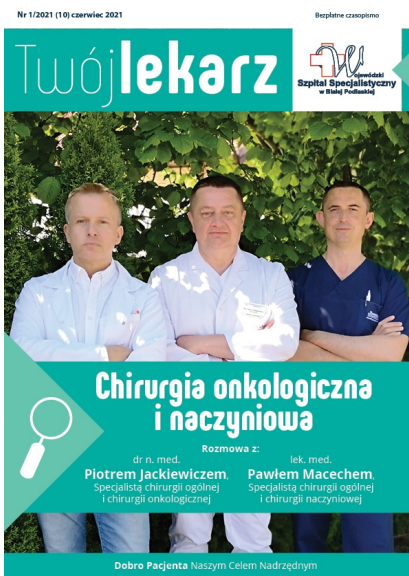
Twój Lekarz - czerwiec 2021