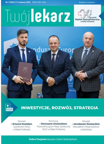
Twój Lekarz - marzec 2025